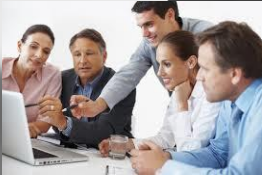
Bekerja di perusahaan ternama