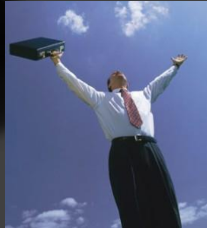
Jadi pengusaha sukses